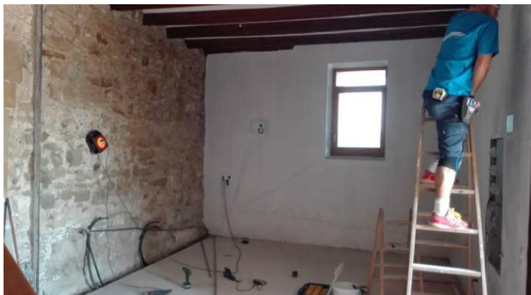
Procés d'execució d'obra de la zona interior

Ajuntament de Balaguer OFICINA TÈCNICA MUNICIPAL