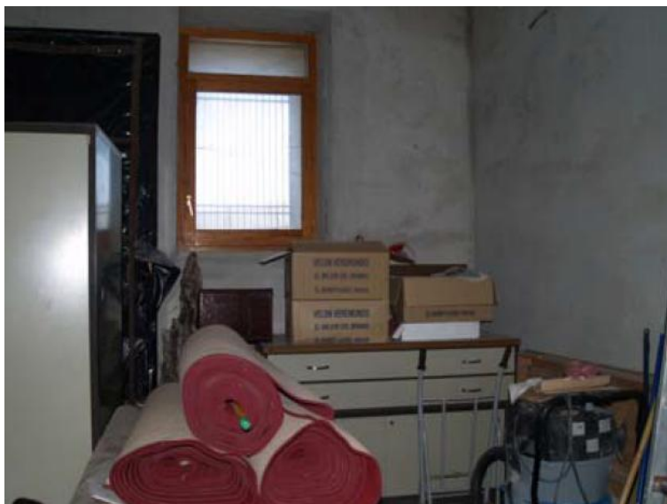
Estat inicial de la Planta Baixa de l'edifici Mudèjar