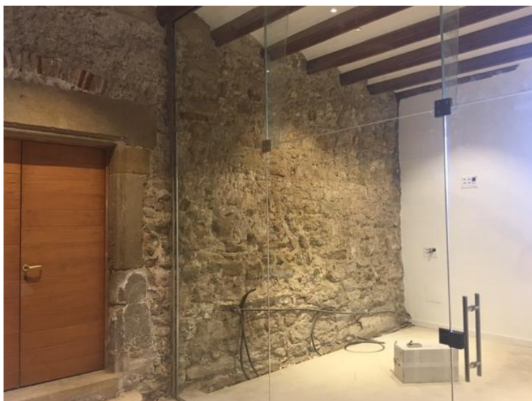
Realització del pas d'instal·lacions i mampara de vidre separadora