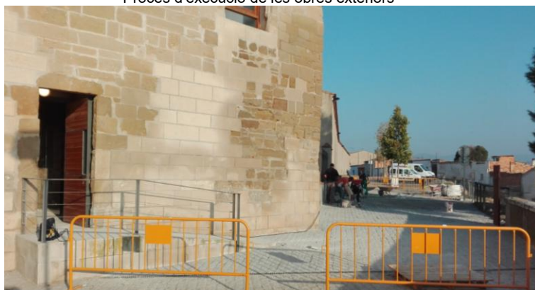
Procés d'execució de les obres exteriors