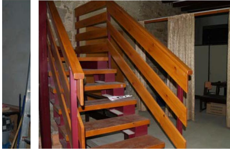
Estat inicial de la planta baixa i escales

Ajuntament de Balaguer OFICINA TÈCNICA MUNICIPAL