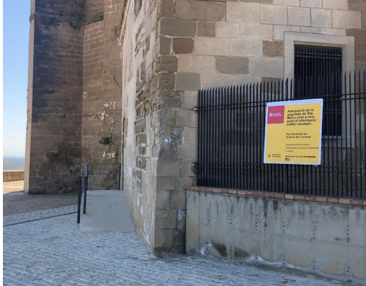
Cartell anunciador de les obres

Ajuntament de Balaguer OFICINA TÈCNICA MUNICIPAL