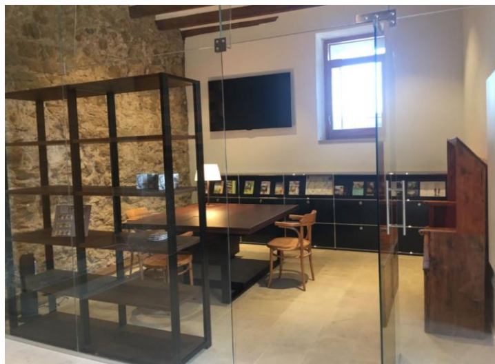
Instal·lació del mobiliari interior necessari per l'obertura del punt d'informació

Ajuntament de Balaguer OFICINA TÈCNICA MUNICIPAL