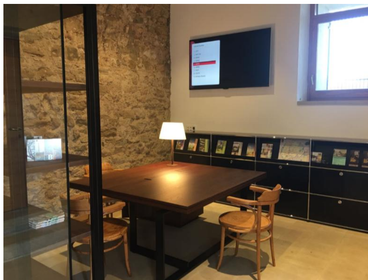
Instal·lació del mobiliari interior necessari per l'obertura del punt d'informació