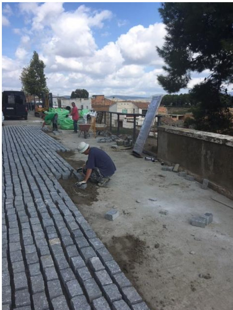
Procés d'execució de les obres exteriors