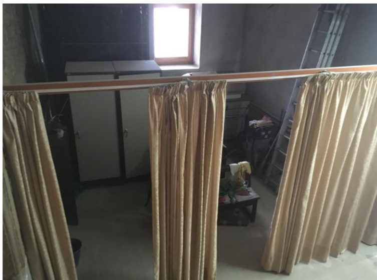
Estat inicial de la Planta Baixa de l'edifici Mudèjar