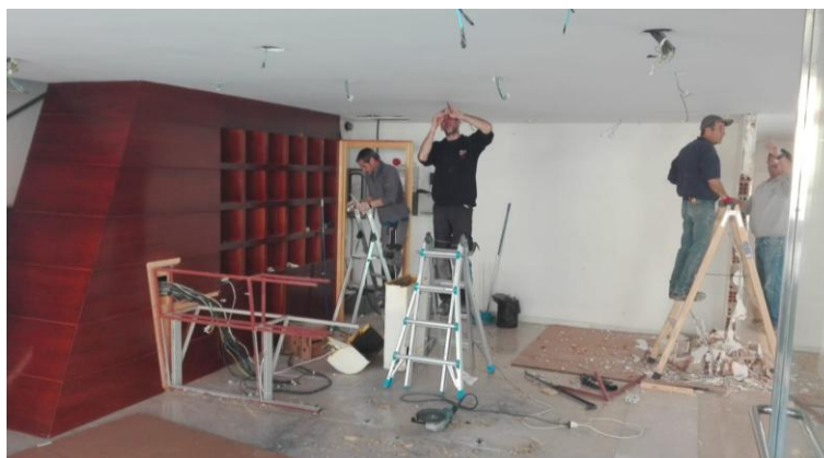
Enderroc del taulell i modificació traçat instal·lacions